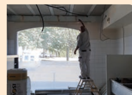
Travaux labo de la boulangerie