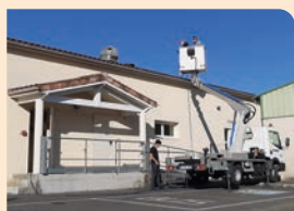
Entretien réglementaire de la cantine scolaire