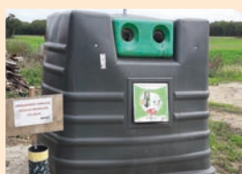
Cube de verre