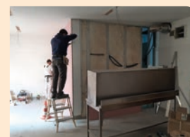
Travaux fournil de la boulangerie