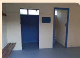
Vestiaires du club de football

La boulangerie : nous avons sélectionné un candidat à la reprise de cette activité très attendue par nombre d'entre vous. Les travaux ont ainsi pu débuter : démontage du four, mise aux normes électrique, changement de compteur, cloisons, plafonds, peintures, porte automatique... Un chantier d'envergure soutenu financièrement par le Département et GrandAngoulême. Ouverture prévue : janvier 2021 !