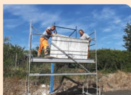
Panneaux de basket de l'école