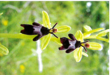
Ophrys mouchie à Sazines

Arrivés à la route, partez à droite en étant très prudents, puis redescendez à gauche au petit parking (si vous avez le temps, poussez jusqu'au "Petit Moulin" en prenant la route à droite et admirez les ponts sur la Nouère). Revenez et continuez tout droit. Vous pourrez deviner la Nouère qui serpente à quelques distances sous les arbres, le long du chemin. D'ailleurs les jardins y sont nombreux et fertiles. Au bout de cet agréable chemin ombragé, prenez à droite puis tout de suite à gauche, vers Gouthiers.